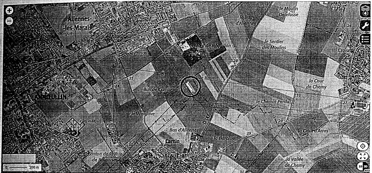
Figure 1 : Localisation du bâtiment d'élevage

La commune n'est pas inscrite au cœur d'un Parc Naturel Régional.